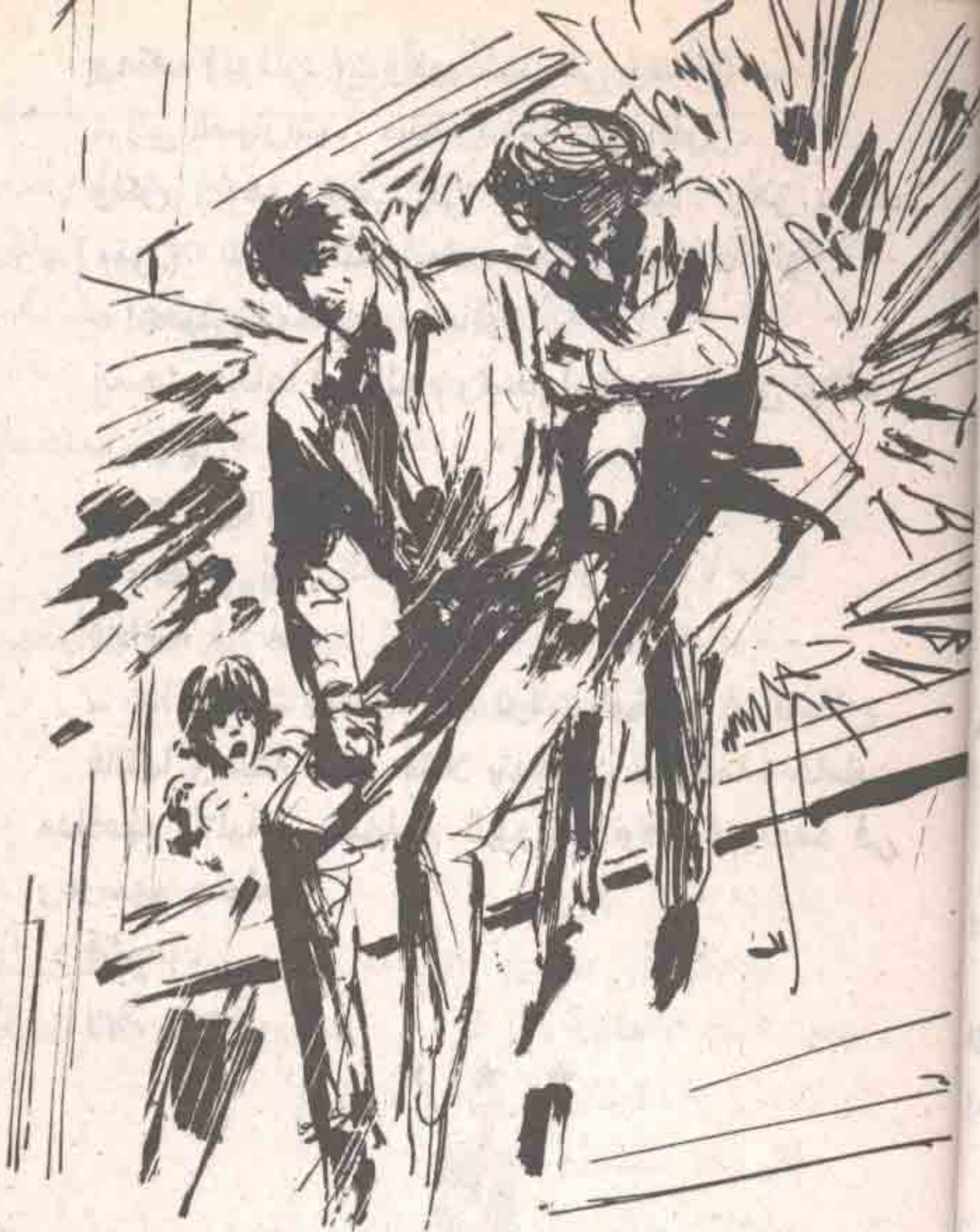
ووثب الاثنان عبر النافذة ، فشهقت السيّدة في رعب واتسعت عيناها في ارتياح ..

ووثب الاثنان عبر النافذة ، فشهقت السيّدة في رعب ، واتسعت عيناها في ارتياح ، واندفعت إلى النافذة ، فشاهدتهما وقد هبطا فوق مظلة واسعة ، لأحد المتاجر التابعة للفندق ، ثم وثبا منها إلى الأرض ، فهتفت :